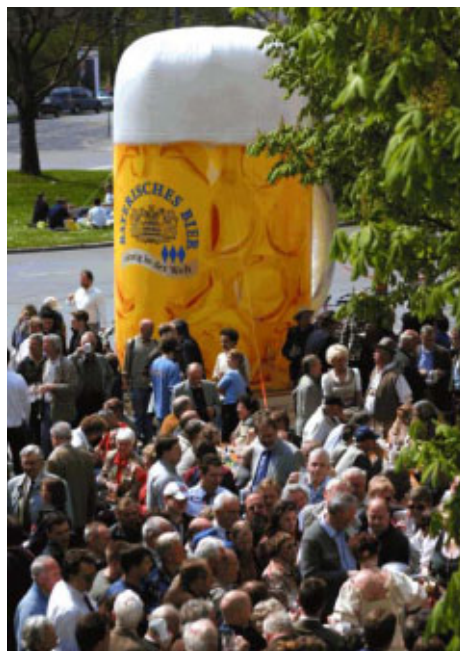
Der größte Maßkrug der Welt stand 2003 in Regensburg.