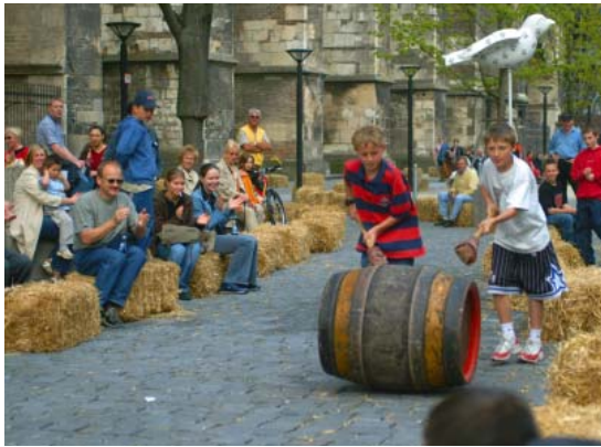
Beim 1. Ulmer Bierfassrollen lieferten sich 25 Teams ein heißes Rennen.