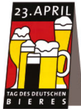
Tischaufsteller Format 3,5 x 9 cm 0,15 € netto (0,18 € inkl. MwSt.)