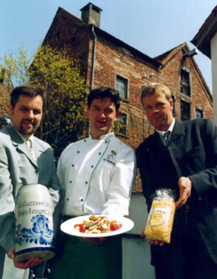
Kreation einer „Bierkrug-Nudel“