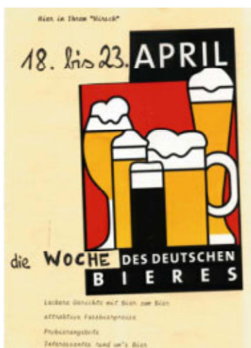
Es muss nicht immer perfekt sein ...