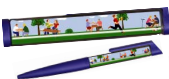
Kugelschreiber in Schwimm-Optik Der rasende Kellner 1,20 € netto (1,43 € inkl. MwSt.)