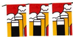
Wimpelkette 10 Fahnen, 3 Meter 2,00 € netto (2,38 € inkl. MwSt.)