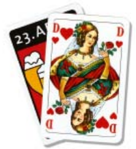
Skatenspiel Französisches Blatt 1,50 € netto (1,79 € inkl. MwSt.)