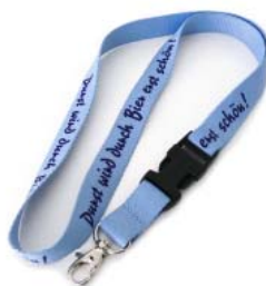
Schlüsselband Durst wird durch Bier erst schön! 1,00 € netto (1,19 € inkl. MwSt.)