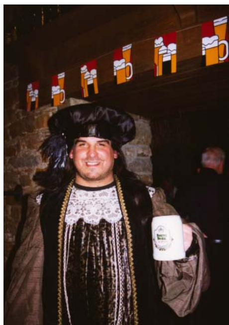
In Bremen wurden 2003 Bier und Buch gemeinsam gefeiert – mit einer Lesung aus Don Quixote.