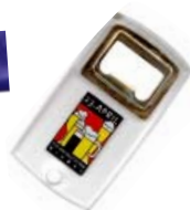
Flaschenöffner Transparent, Plexi mit Metall 1,00 € netto (1,19 € inkl. MwSt.)