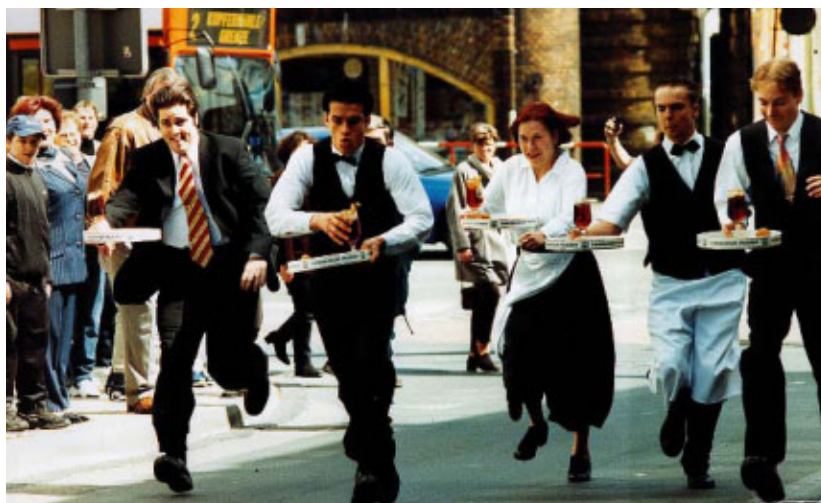
Ein heißes Rennen lieferten sich 2001 die Kellner in Flensburg.