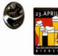
Ansteck-Pin Metall mit Versiegelung 0,70 € netto (0,83 € inkl. MwSt.)