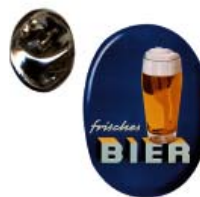
Ansteck-Pin: Oval Metall mit hochwertiger Versiegelung 1,00 € netto (1,19 € inkl. MwSt.)