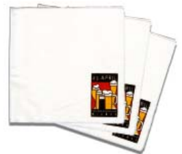
Serviette Hochwertiger Zellstoff 0,15 € netto (0,18 € inkl. MwSt.)