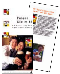
Faltblatt Über das Reinheitsgebot und den „Tag des Bieres“ 0,10 € netto (0,12 € inkl. MwSt.)