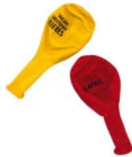
Luftballon Gelb und rot gemischt 0,15 € netto (0,18 € inkl. MwSt.)