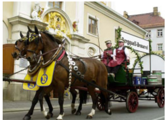
Bierauslieferung mit zwei Pferdestärken: 2002 die Attraktion in Löbau.