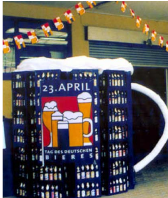
Blickfang im Getränkemarkt: Ein überdimensionaler Bierkrug, gebaut aus Mischkästen.