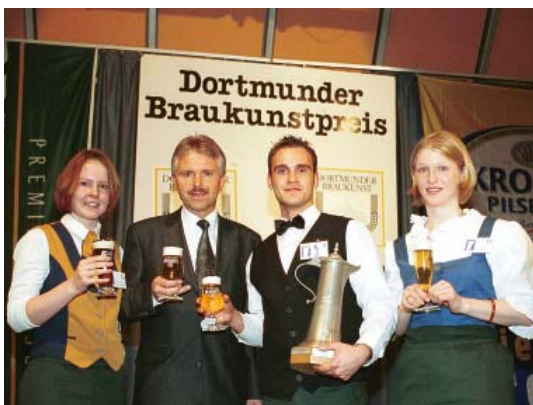
Preisverleihung beim Dortmunder Braukunstpreis