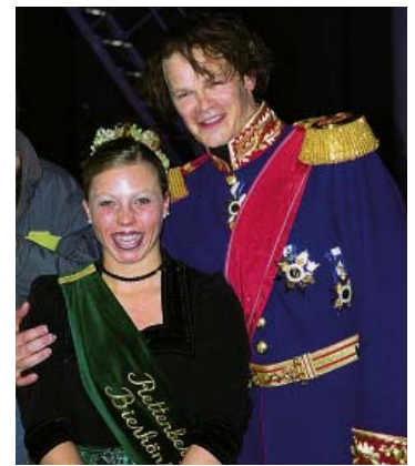
Ein Double von König Ludwig gratulierte 2001 der Bierkönigin von Rettenberg.