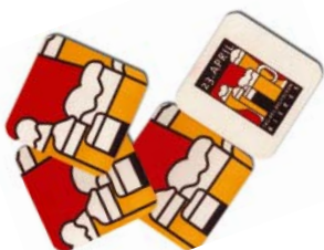
Bierdeckel Pappe, 1,6 mm Stärke 0,05 € netto (0,06 € inkl. MwSt.)