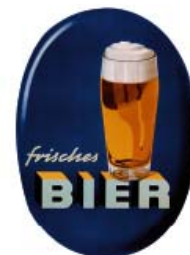
Magnet: Blaues Oval Format 5,7 x 4 cm Metall mit Versiegelung 2,00 € netto (2,38 € inkl. MwSt.)